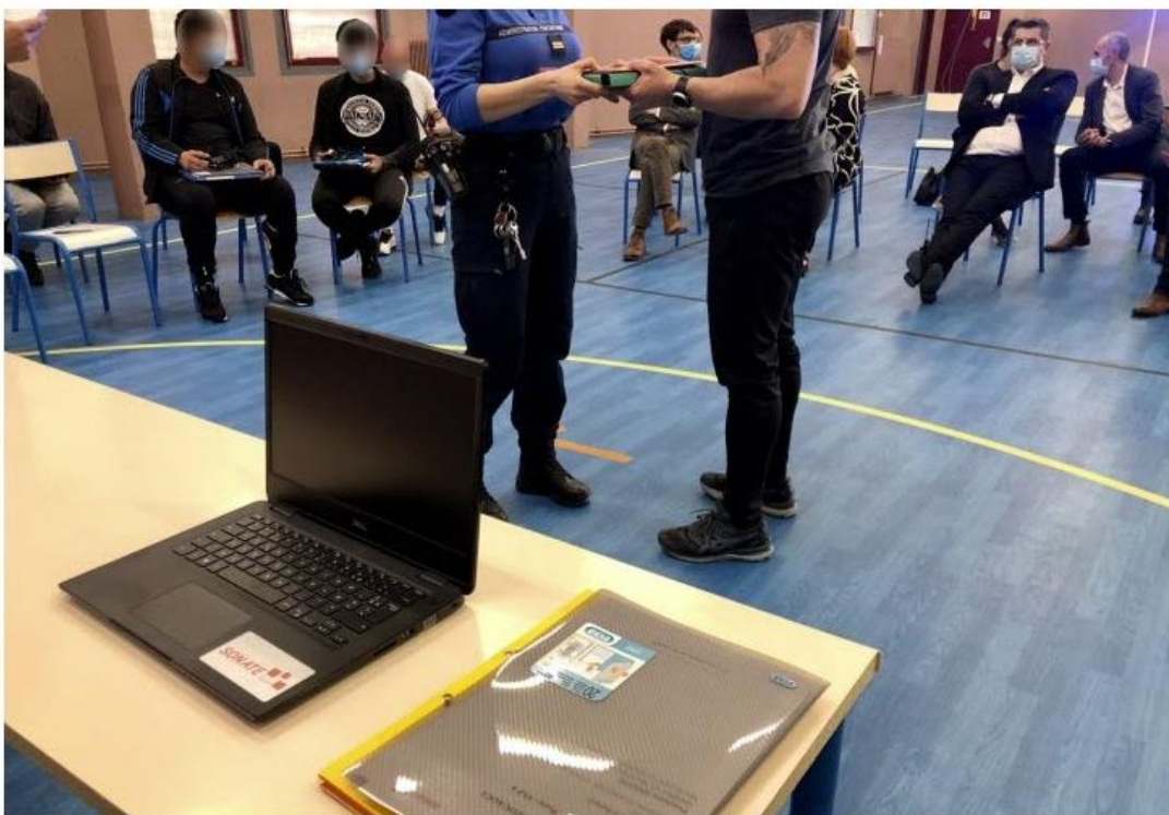
Remise en mains propres d'un ordinateur à un détenu

02 avr. 2021 à 19:07 | mis à jour à 19:16 - Temps de lecture : 1 min