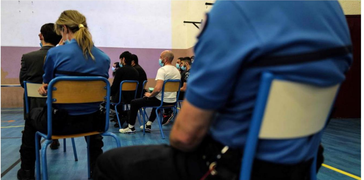
Les prisonniers attendent de recevoir un ordinateur pour suivre des cours et décrocher un diplôme.

https://www.sudouest.fr/france/premiere-en-france-des-detenus-equipes-d-ordinateurs-pour-etudier-1938916.php