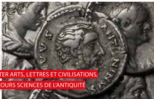
MASTER ARTS, LETTRES ET CIVILISATIONS, PARCOURS SCIENCES DE L'ANTIQUITÉ