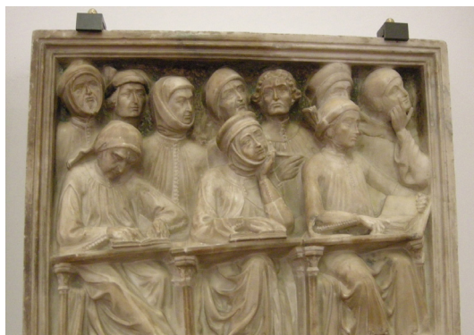
Studenti universitari. Dettaglio da: Pier Paolo delle Masegne e Jacobello da Bologna, Frammenti dell'arca di Giovanni da Legnano (morto nel 1383), esposta nel Museo civico medievale a Bologna.