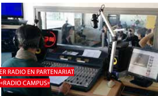
ATELIER RADIO EN PARTENARIAT AVEC «RADIO CAMPUS»

Ce parcours à orientation professionnalisante permet à des étudiants issus de différents cursus d'approfondir leur connaissance du secteur culturel et de ses enjeux locaux, nationaux, voire internationaux, de développer leur capacité à écrire pour la culture sur différents supports et d'acquérir les compétences et la méthodologie nécessaires à l'action culturelle.