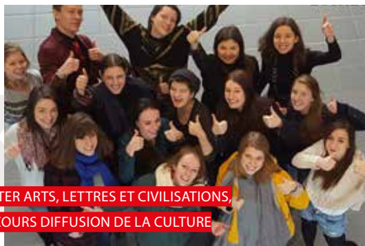
MASTER ARTS, LETTRES ET CIVILISATIONS, PARCOURS DIFFUSION DE LA CULTURE