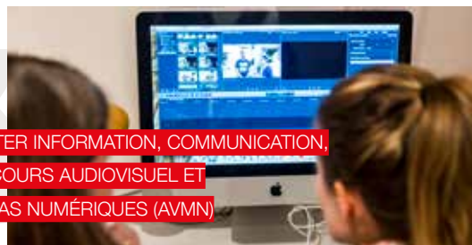
MASTER INFORMATION, COMMUNICATION, PARCOURS AUDIOVISUEL ET MÉDIAS NUMÉRIQUES (AVMN)

L'ensemble des parcours de la mention est adossé à un laboratoire de recherche reconnu dans les sciences de l'information et de la communication, le Groupe de recherche sur les enjeux de la communication (GRESEC).