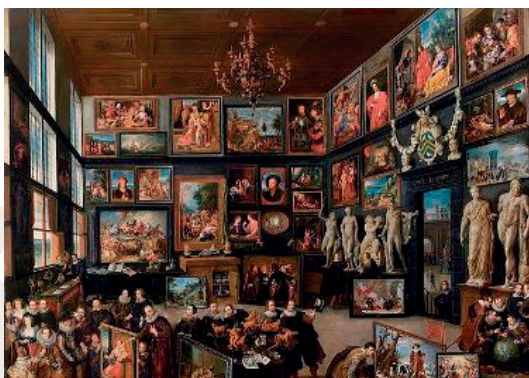
La galerie de Cornelis van der Geest - Willem van Haecht, 1628